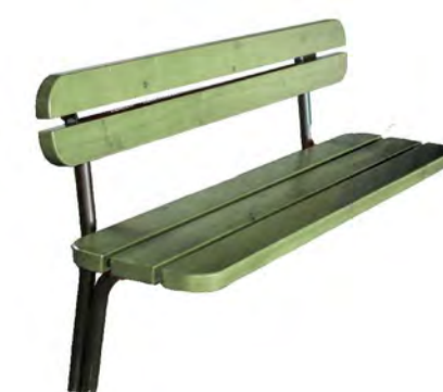
2. Jaakko- penkki