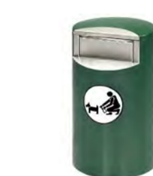
1. Roska-astia, esim. Lehtovuori City 60 Doggy