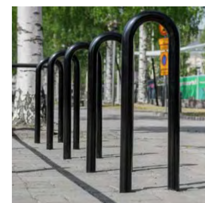
5. Pyöräteline, runkolukitus

Tässä suunnitelmassa on käytetty ETRS-GK24/N2000 taso- ja korkeuskoordinaatistoa